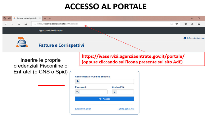
Figura 1 – Accesso all'area autenticata “Fatture e Corrispettivi”

Appare utile evidenziare, infine, come non risultano esservi motivi per rinunciare all'opportunità di attivare il servizio gratuito dell'Agenzia delle entrate anche laddove si scelga di fruire comunque delle soluzioni (a pagamento) offerte dalle software house o dai gestori in outsourcing . Soluzioni, quelle di mercato, che spesso prevedono condizioni generali che tendono a ostacolare eventuali recessi. Fra le condizioni generali dei servizi di mercato non è raro osservare infatti clausole che, in caso di recesso, prevedono la cancellazione degli archivi entro pochi giorni (ad esempio 45) dalla cessazione del contratto (si ricordi che le fatture – civilisticamente – vanno conservate per almeno 10 anni).